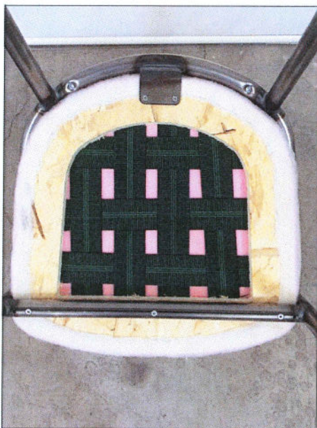
Vista da sotto